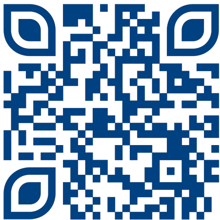
подробности на сайте